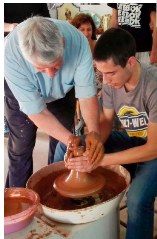
Santuario del Saliente Albox

Regreso al hotel para comer y fin de viaje.